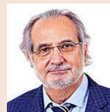
Joan Perdigó Tornos Abogados